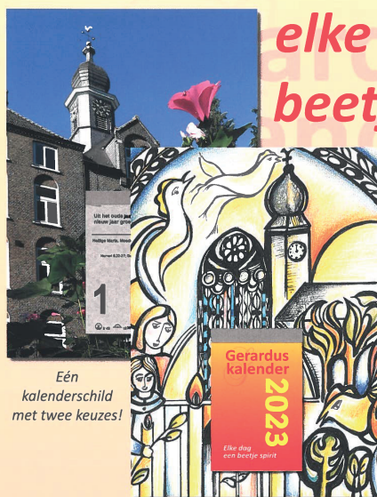
Eén kalenderschild met twee keuzes!